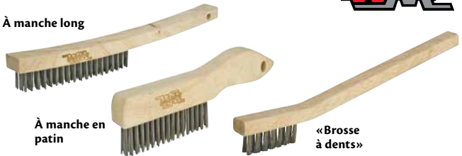
À manche en patin