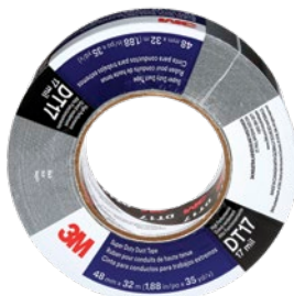
Prix par rouleau