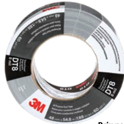
Prix par rouleau