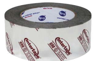
Prix par rouleau