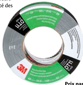
Prix par rouleau